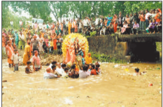
अखण्ड मनोकामना दीपों को देवती नाला में श्रद्धापूर्वक विसर्जन किया गया। विसर्जन यात्रा में समिति के पदाधिकारियों के साथ ही बड़ी संख्या में श्रद्धालु उपस्थित थे।

बिहारपुर। नवरात्रि की 10 दिवसीय उपासना के बाद गुरुवार को देवी प्रतिमा एवं अखण्ड ज्योति कलशों को श्रद्धापूर्वक विसर्जन किया गया। इस दौरान बड़ी संख्या में क्षेत्रवासी देवी का जयकारा लगाते हुए विसर्जन स्थल पर पहुंचे थे। चैत्र नवरात्रि के अवसर पर गढ़वतिया देवी धाम में दुर्गा प्रतिमा की स्थापना की गई थी साथ ही अखण्ड मनोकामना दीप प्रज्वलित किए गए थे। इस दौरान पूरी नवरात्रि विधि-विधान से देवी की नियमित पूजा, आरती की गई। नवरात्रि में देवी की पूजा करने हर दिन बड़ी संख्या में श्रद्धालु पहुंच रहे थे। मूलभूत सुविधाओं की कमी के बावजूद श्रद्धालुओं ने धाम की कष्टसाध्य चढ़ाई पूरी कर उत्साहपूर्वक देवी की पूजा अर्चना में व्यस्त रहे। इस दौरान कोई