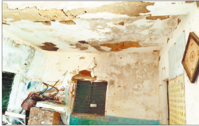
जर्जर भवन का उखड़ा प्लास्टर।