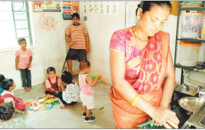
रसोई में पढ़ाई करते बच्चे।